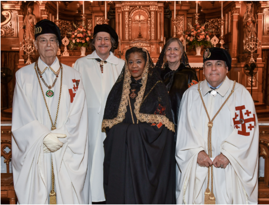
Generalstatthalter Agostino Borromeo vertrat das Großmagisterium in Chicago.